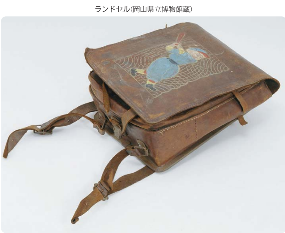
ランドセル(岡山市立博物館蔵)