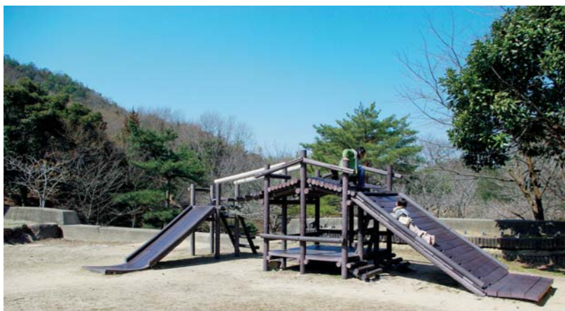
岡山市南区小串、阿津地内

小串・阿津地区にまたがる貝殻山の一角180畝の市有林で、その中央にある旧小名郷池には遊具を備えた芝生広場がある。 アスレチック風の複合遊具では、木の板でできた滑り台や、丸太状の部材を使った渡りの遊びが楽しめる。